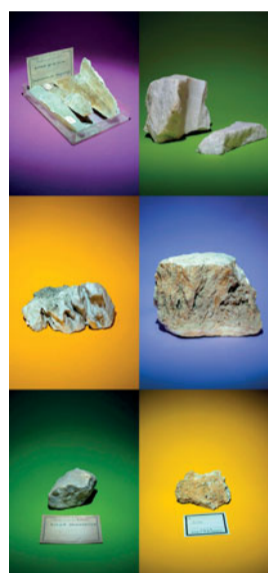
Karolina Sobel, aus der Serie »Les Fontis«