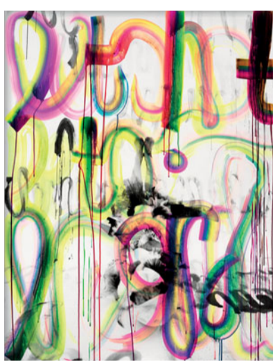
Helen Feifel, Untitled (I. MIYAKE), 2021, Courtesy Helen Feifel und Kadel Willborn, Düsseldorf, © VG Bild-Kunst, Bonn 2022